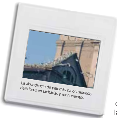
La abundancia de palomas ha ocasionado deterioros en fachadas y monumentos.

Además, el sonido y la presencia de las aves hacen más agradable la estancia en la ciudad.