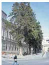
Casuarinas junto al Teatro Romea

La mayoría de árboles de la ciudad se corresponden con especies exóticas, es decir, que de forma natural crecen en otros países. Es el caso de los Ficus, como el de Santo Domingo o de las altas Casuarinas que rodean el Teatro Romea.