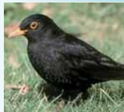
Podemos ver mirlos en los jardines.

En cuanto al grupo de los mamíferos es de destacar el Murciélago común que veremos, en las noches de primavera y verano, cazando los insectos que vuelan junto a las farolas. Otro grupo de animales presentes en la ciudad son los reptiles: la Salamandresa, devoradora de insectos o la conocida Lagartija ibérica son un buen ejemplo de ello. Para detectar la presencia de anfibios, basta con acercarnos al río en las noches de verano para escuchar a las ruidosas ranas que habitan en él.