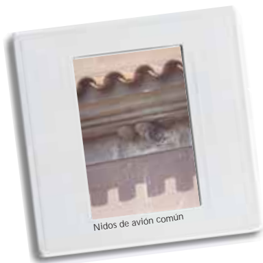
Nidos de avión común

Algunas de las aves que habitan en la ciudad son insectívoras. Esto las convierte en controladoras de las poblaciones de insectos haciendo las veces de un insecticida natural.