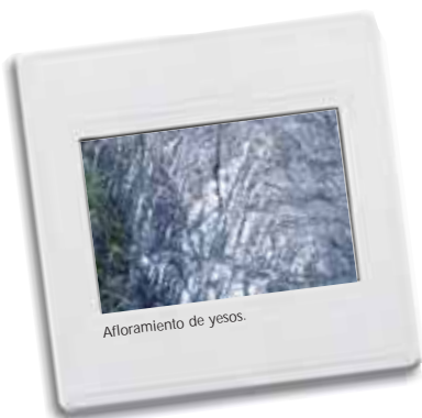
Afforamiento de yesos.

Si bien no es fácil distinguir a simple vista los yesos, su presencia puede ser delatada por distintas especies vegetales que únicamente crecen en estos sustratos. Son las llamadas especies indicadoras de yesos. Entre ellas destacan la Quebraollas o Garbanzo silvestre ( Ononis tridentata ) que reconoceremos por presentar en sus hojas un margen con tres dientes y el Helianthemum