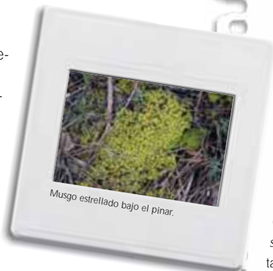
Musgo estrellado bajo el pinar.

Pero los yesos del municipio no sólo tienen interés desde el punto de vista ambiental. Poseen, también, importancia cultural ya que en tiempos pasados este recurso natural fue utilizado como motor de la economía local. Las canteras, hornos de cocción y eras de molienda que aún se dejan ver en los alrededores de las zonas con yesos, lo ponen de manifiesto.