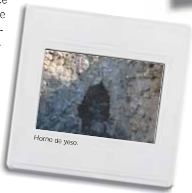
Horno de yeso.

Otra actividad humana tradicional ha sido el pastoreo, siendo ésta zona de paso de ganado como constata la presencia de la Cañada Real de Torreagüera. Asimismo, Algezares y sus alrededores han sido utilizados como zonas de cultivo, utilizando para ello, pequeños huertos.