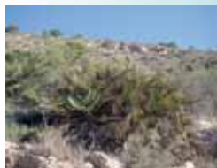
Palmitos en la solana de la sierra.

La fauna más característica de la sierra está constituida por las aves rapaces que aprovechan la diversidad de paisajes que ofrece la zona para satisfacer sus distintas necesidades. Así, la