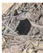
Lero: nido de araña.

La fauna más característica de la sierra está constituida por las aves rapaces que aprovechan la diversidad de paisajes que ofrece la zona para satisfacer sus distintas necesidades. Así, la