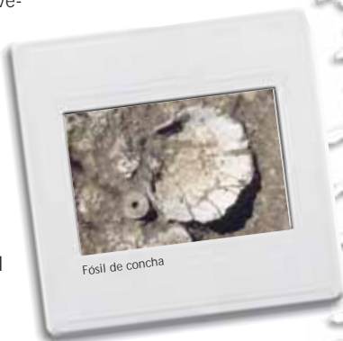
Fósil de concha

La umbría de la Sierra de Altaona presenta un denso pinar de Pino carrasco ( Pinus halepensis ). El estrato arbustivo está formado por el lentisco ( Pistacia lentiscus ), el palmito ( Chamaerops humilis ), la jara ( Cistus albidus ) y el romero ( Rosmarinus officinalis ). El más bajo, el herbáceo, por una gran masa de lastón ( Brachypodium retusum ) y, bajo éste, en la época de mayor humedad, el musgo cubre todo el suelo dando un aspecto mullido.