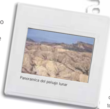
Panorámica del paisaje lunar

el Collado de los Gino-vinos para atravesar las sierras que separan la costa del interior.