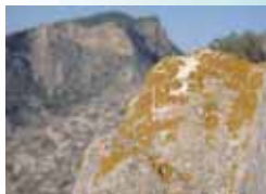
Líquenes del género Xanthoria

Es frecuente ver unas manchas anaranjadas cubriendo las rocas. Son líquenes, organismos formados por la asociación de un hongo con un alga. Estos líquenes son del género Xanthoria.