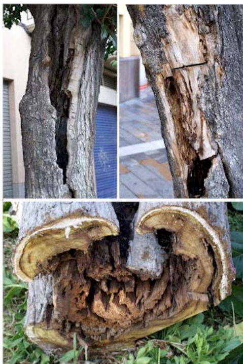
Las podas continuas aceleran el decaimiento

estilo muy corto y 2 estigmas blancos. Los frutos son sincarpas carnosos de 1-2 cm de largo, blancos, a veces rosados o casi negros en algunas variedades, pedunculados, oval-oblongos, formados por numerosas drupas de pequeño tamaño encerradas o envueltas por el perianto carnoso.