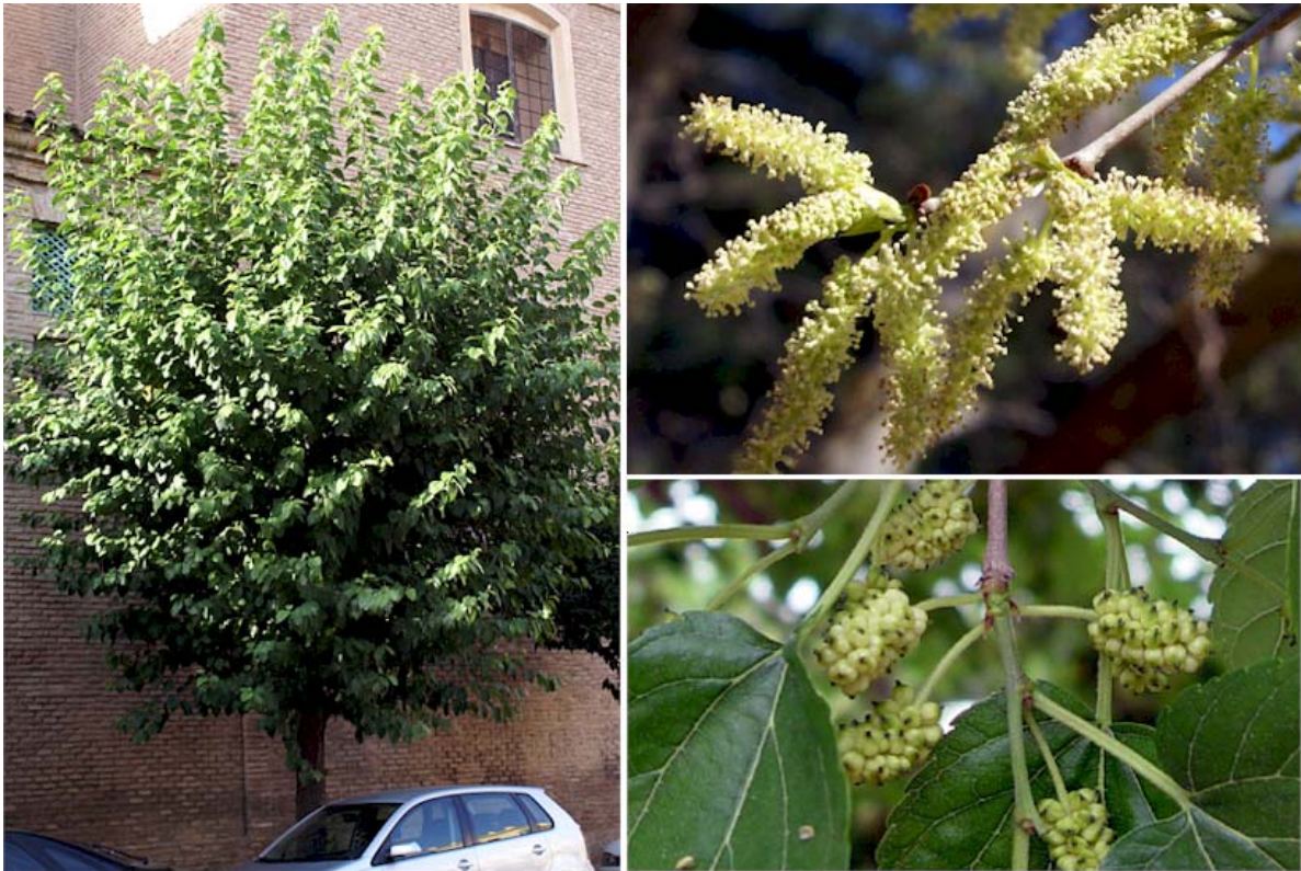
Aspecto general en Agosto, detalle de flores en Marzo y detalle de los frutos en Abril