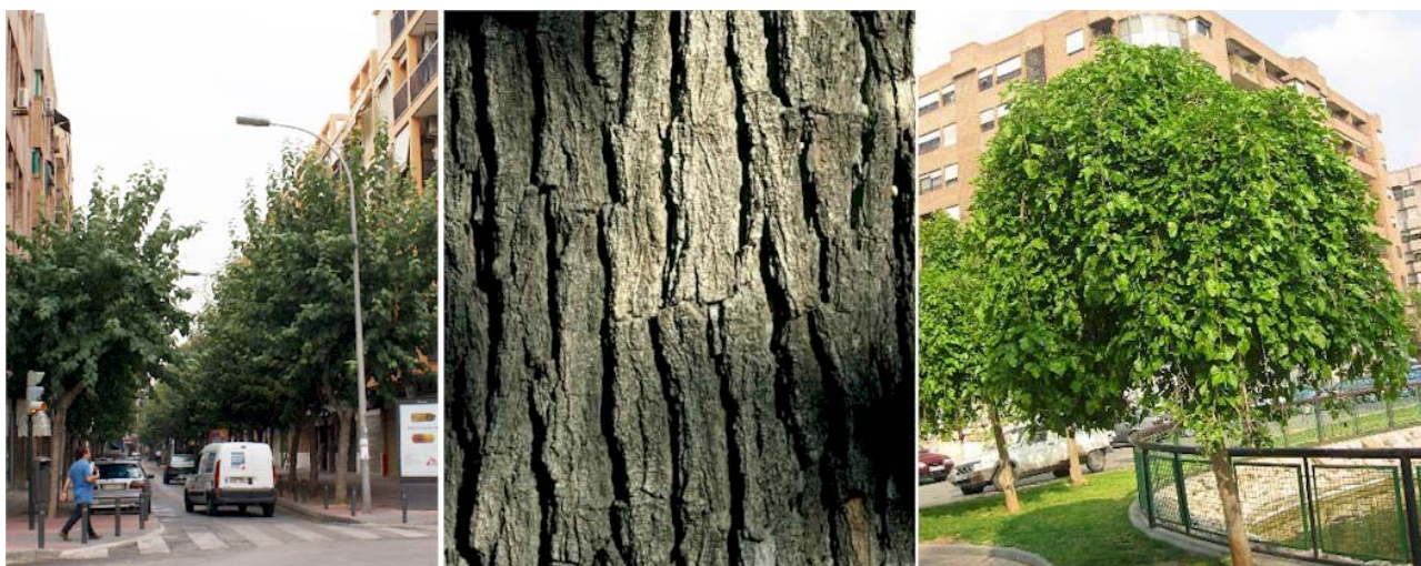
Alineación de moreras en Alameda de Capuchinos, detalle de la corteza del tronco y aspecto del cultivar 'Pendula'

Localización: especie frecuentísima en Murcia y sus Pedanías, especialmente como árbol de alineación en calles, donde hay inventariadas unas 13.000 unidades. Las fuertes y constantes podas a las que se ven sometidos, además de envejecerlos y acelerar su decaimiento prematuramente, impiden que puedan verse ejemplares con un porte especialmente notable.